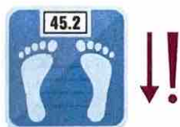
Ndryshim në peshë