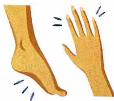
Ndjesi si shpim me gjilpëra ose mpirje në duar apo këmbë