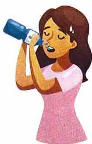
Etje e shtuar