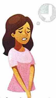
Urinim i shpeshtë