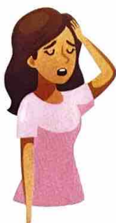
Lodhje esktrreme ose mundesë e energjisë